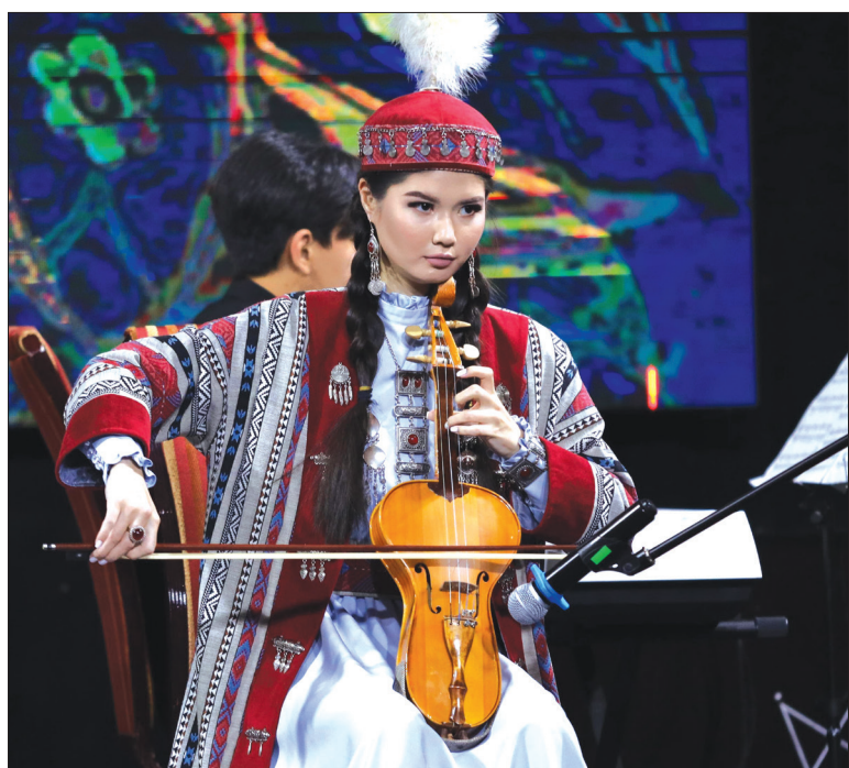
Алматинская исполнительница рассказала об истории древнего инструмента