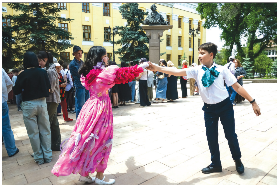
В Алматы презентовали коллекцию пушкинской моды