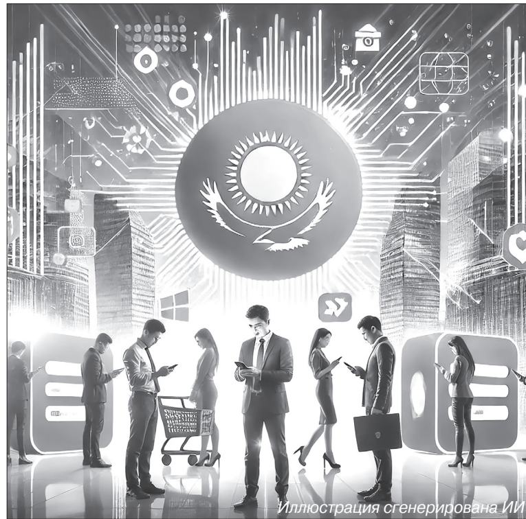
Иллюстрация сгенерирована ИИ

К примеру, в настоящее время в мегаполисе реализуется проект Almaty Cyber Games (ACG), который направлен на создание в Алматы главного хаба киберспорта и игровой индустрии в Центральной Азии. В Управлении цифровизации города рассказали, что заключен ряд соглашений и подписан меморандум о