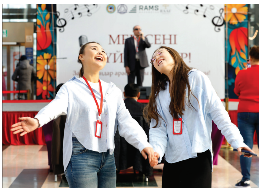
В Международный день слепых в мегаполисе прошел вокальный конкурс