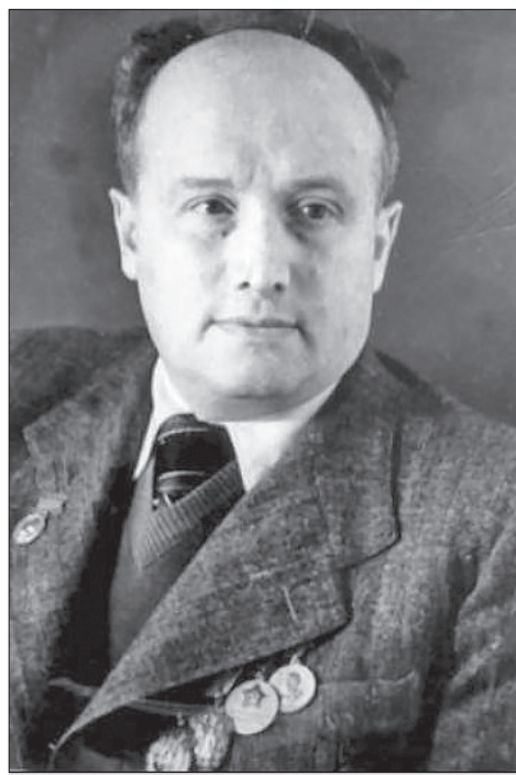
Евгений Брусиловский (1905–1981) – народный артист Казахской ССР (1936), лауреат государственных премий СССР (1948) и Казахстана (1967), член Союза композиторов СССР, автор первой национальной оперы «Кыз-Жибек»

Известный актер В.И. Качалов не скрывал своего восхищения: «Спектакли Казахского государственного оперного театра незабываемы по своей красоте, силе и мастерству». Поэт и писатель Демьян Бедный отмечал в статье: «Я с напряженным волнением смотрел волшебное зрелище, каким мне представился спектакль молодого казахского театра. Актеры так даровиты, чудесная певица Куляш Байсеитова так чарующе трогательна в созданном ею образе. Я не нахожу слов для выражения моей радости...» После выступления в роли Кыз-Жибек вся Москва называла Куляш Байсеитову «казахским соловьем», было ей 24 года, ей в числе первых в Союзе дали звание народной артистки СССР (1936). Ария «Гакку» (песня лебедя)